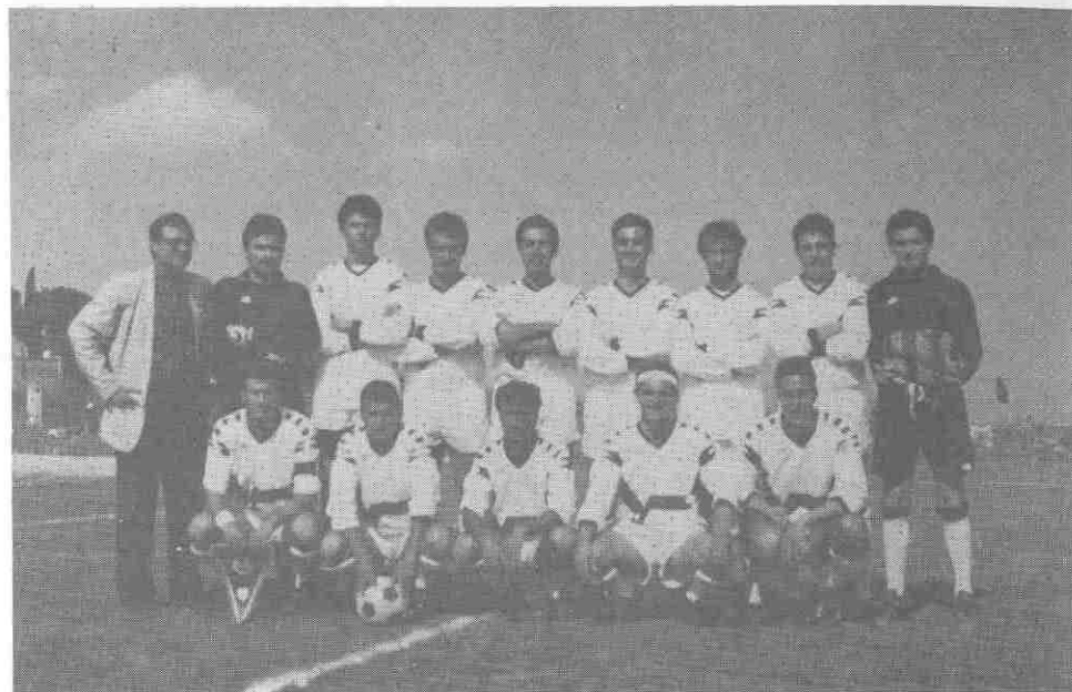
U.S. TORREMAGGIORE 88/89

Queste le foto delle due formazioni che si sono incontrate al campo sportivo comunale di Torremaggiore.