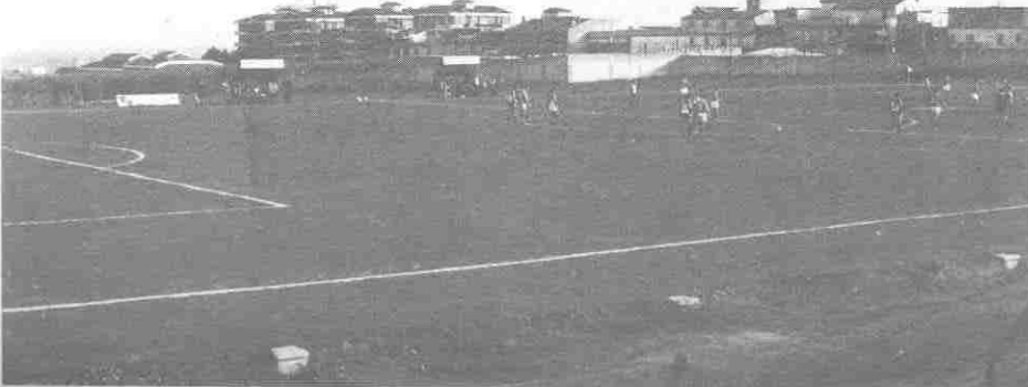
IL CAMPO SPORTIVO COMUNALE NEL 1990.