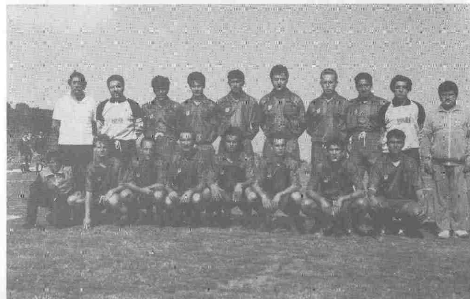
U.S. PALAGIANO 88/89