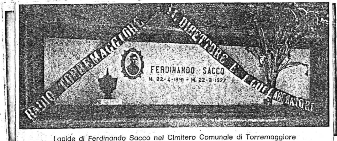
Lapide di Ferdinando Sacco nel Cimitero Comunale di Torremaggiore